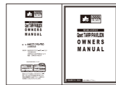
オーナーズマニュアル

設置やお手入れ等に便利な手引きや、注意事項などが書かれた「オーナーズマニュアル」が同梱されています。お出掛けになる前に必ずお読みください。また、事前に広い場所で部品のチェックと組立ての練習を行ってください。